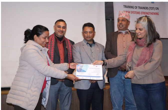
मुख्य प्रशिक्षकहरू सहभागीलाई प्रमाणपत्र प्रदान गर्दै