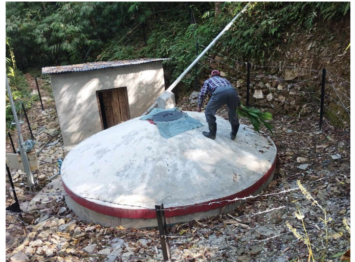
दोस्रो तहको लिफ्ट प्रणाली