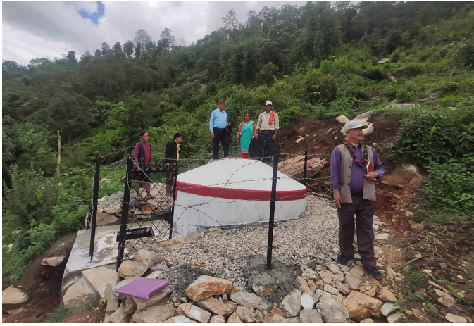
गाउँको शिरानमा रहेको पानी वितरण गर्ने ट्याङ्की