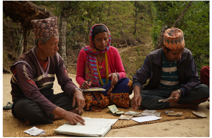
उपभोक्ता समितिका मुख्य पदहरूमा महिलाहरूको भूमिका प्रशंसनीय देखिएको छ

नेवाले खानेपानी तथा सरसफाइ उपभोक्ता समिति गठन गर्दादेखि आयोजनाको सञ्चालन र मर्मत सम्भारमा महत्वपूर्ण भूमिका खेल्ने मर्मत कार्यकर्ता चयन गर्दा र विभिन्न क्षमता विकास क्रियाकलाप सञ्चालन गर्दा लैङ्गिक र समावेशी नीतिलाई मध्यनजर गरी कार्यान्वयन गर्दै आएको छ । नेवाले १९९९ देखि खासस्व आयोजनाहरूमा लैङ्गिक र गरिबी संवेदनशील दृष्टिकोण (Gender and Poverty Sensitive Approach) लागू गरी संगठित रूपमा खासस्व कार्यक्रममा लैङ्गिक असमानता र गरिबीका मुद्दाहरूलाई सम्बोधन गर्दै आएको हो । लैङ्गिक समानता र सामाजिक समावेशीकरणका मुद्दाहरूलाई अभि प्रभावकारी रूपमा सम्बोधन गर्न नेवाले सन् २००७ देखि लैङ्गिक समानता र सामाजिक समावेशीकरण (लैससास) नीति अवलम्बन गर्‍यो । यस नीतिले आयोजना कार्यान्वयन गरिने समुदायमा उपभोक्ताहरूको सम्पन्नता स्तरीकरण (Wellbeing ranking) गरेर उनीहरूको आर्थिक अवस्था अनुसारको श्रमदान एवं मर्मत सम्भार कोषको शुल्क निर्धारणको आधार खोजिने पद्धतिको थालनी भयो । त्यसैगरी आयोजनाको निर्णय प्रक्रियामा महिलाहरूको सहभागितालाई अर्थपूर्ण बनाउन उपभोक्ता समितिका पदाधिकारीहरूमा ५० प्रतिशत महिलाहरूको सहभागिता एवं आयोजनाले पारिश्रमिक दिने कार्यमा महिला एवं विपन्न वर्गका समूहको सुनिश्चितता गर्ने कार्य प्रारम्भ भयो । नेवा लगायतका विभिन्न संघ संस्थाहरूको निरन्तर पैरवीका कारण यो पद्धति नेपाल सरकारद्वारा