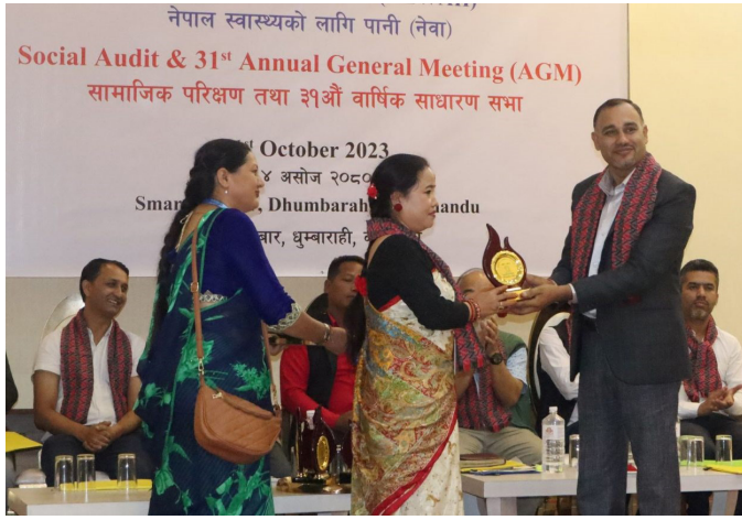
नेवाका उत्कृष्ट कर्मचारीहरूलाई सम्मानित गरिदै

गाउँपालिकाका दाजुभाइ दिदी बहिनीहरूको मुहार आज हँसिलो देख्दा आफूलाई समेत सन्तुष्टि मिलेको बताउनुभयो ।