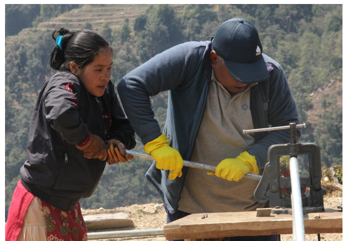
प्राविधिक होस् या प्रशासनिक, सबै काम महिला पुरुष दुवैले समान ढङ्गले गर्न सक्छन्

खासस्व कार्यक्रमका प्रत्येक चरणमा नेवाले महिलाहरूको अर्थपूर्ण सहभागितालाई सुनिश्चित गर्न यसका नियमित कार्यक्रममा विभिन्न क्रियाकलापहरू समावेश गर्ने गरेको छ ।