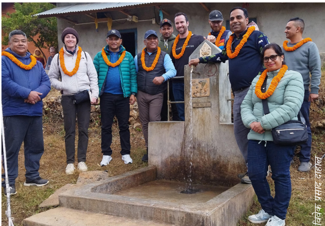
च्यारिटी वाटरका प्रतिनिधिहरू सम्मिलित टोलीले सिन्धुलीस्थित खानेपानी तथा सरसफाइ आयोजनाको अनुगमन गर्दै

अनुगमन टोलीले उपभोक्ता समितिका पदाधिकारीहरूसँग खानेपानी आयोजना दिगो राख्न गरिएका पहलहरू, मर्मत सम्भार कार्यकर्ताको व्यवस्था, खानेपानी गुणस्तर परीक्षण, भैपरि आउने समयमा आयोजना सुचारु राख्न चालिने कदमहरू तथा मर्मत सम्भार कोष रकम र जगेडा सामग्रीको व्यवस्थापन र परिचालनका बारेमा छलफल गर्नुका साथै ओडारे खानेपानी उपभोक्ता समितिसँग आयोजना पुनः मर्मत सम्भार गर्नु पर्ने कारण र यसबाट खानेपानी आयोजनामा पर्न गएको असरबारे जानकारी लिएको थियो ।