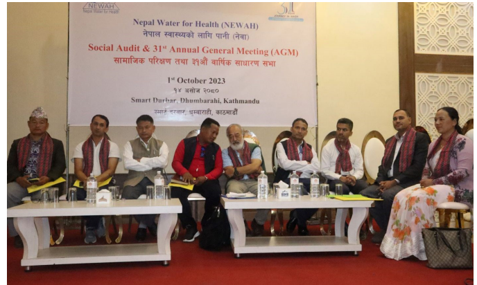
साधारण सभामा आमन्त्रित पाहुना तथा विशिष्ट व्यक्तिहरू