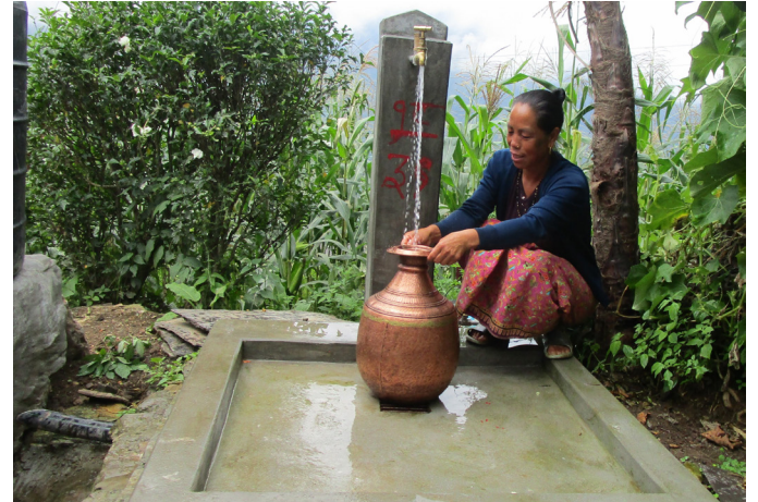
भेडीखर्कका घर घरमा बनेका धारा

यसरी कुनै बेला पानी पैचो समेत नपाइने भेडीखर्क गाउँको ठूलो दुःख आज पानीले धोइदिएको छ।