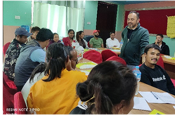
सिन्धुलीमा सञ्चालित तालिमका सहभागीहरू

नेवाले आयोजनाको सम्पूर्ण व्यवस्थापन तथा प्राविधिक निरिक्षणका लागि एक जना प्राविधिक कर्मचारी, स्वच्छता तथा सरसफाइ