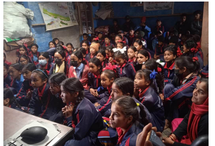
सामाजिक जनजीवनका प्रत्येक क्षेत्रमा किशोरी तथा महिलाहरूको समतामूलक सहभागिता आवश्यक छ