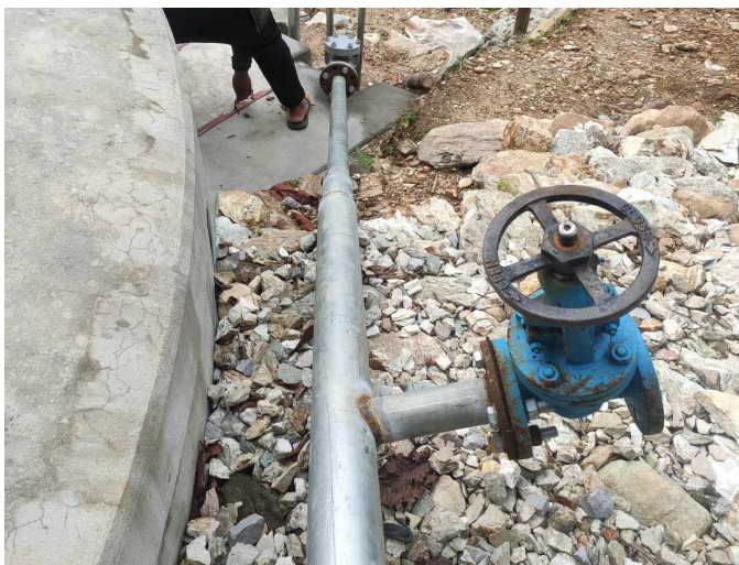
मुहान र पहिलो तहको लिफ्ट प्रणाली