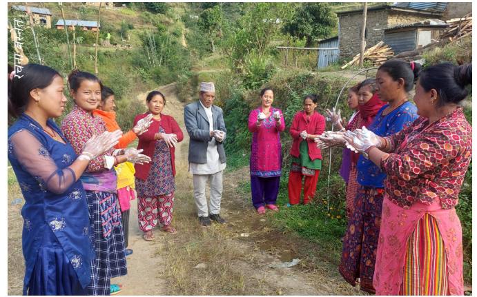
कर्थली खानेपानी आयोजना, काभ्रेमा सामुदायिक स्वास्थ्य स्वयंसेवक तालिम सञ्चालनका क्रममा साबुन पानीले हात धुने कार्यको प्रदर्शन गर्दै तालिमका सहभागीहरू

यस दिवसलाई सार्थक तरिकाले मनाउने क्रममा नेवा, वागमती प्रदेश कार्यालय सिन्धुली अन्तर्गतका स्थानीय तहहरू कमलामाई र दुधौली नगरपालिकाका साथै मरिण, हरिहरपुरगढी, सुनकोशी, फिक्कल, गोलन्जोर र तीनपाटन गाउँपालिकामा २० वटा र काभ्रे जिल्लाको रोशी र खानीखोला गाउँपालिकाका ११ वटा गरी यस आर्थिक वर्षमा सञ्चालित ३१ वटा खानेपानी तथा सरसफाइ आयोजनाहरूमा कार्यरत