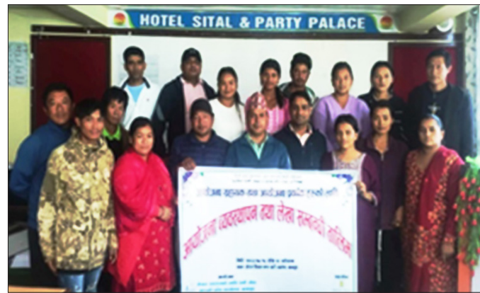
बागलुङमा सञ्चालित तालिमका सहभागीहरू

प्रवर्द्धनका लागि एक जना वरिष्ठ स्वच्छता तथा सरसफाइ सहजकर्ता खटाउने गर्दछ । यसैगरी स्थानीय स्तरमा समन्वयका साथै नेवाबाट उपभोक्ता समितिलाई प्रदान गरिने तथा पालिकाबाट प्राप्त हुने साभेदारी रकमको हिसाब किताब राखी समयमै प्रतिवेदन तयार गरी नेवा तथा पालिकामा पेश गर्नका लागि एकजना स्थानीय कर्मचारी पनि छनोट गरिन्छ । आयोजना सहायकलाई सम्बन्धित वडाले र आयोजना प्रवर्द्धकलाई उपभोक्ता समितिले छनोट गर्दछ भने कामको जिम्मेवारी अनुसार उनीहरूको पारिश्रमिक पनि फरक फरक हुन्छ । नेवाले सञ्चालन गरेको तालिम पनि यसरी छनोट भएका कर्मचारीहरूको आयोजना व्यवस्थापन सम्बन्धी सीप अभिवृद्धि गर्ने उद्देश्यका साथ सञ्चालन गरिएको हो ।