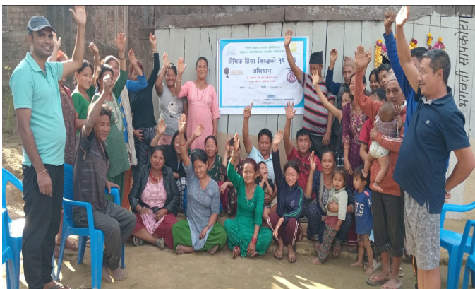
लैङ्गिक हिंसा विरुद्धको दिवस मनाउँदै समुदायका सदस्यहरू

नेवाको ध्येय मूलतः समुदायमा सुरक्षित खानेपानी, सरसफाइ र स्वच्छता प्रवर्द्धन भए तापनि लैंगिक तथा सामाजिक समावेशीकरणको नीतिलाई आत्मसात गरेको हुनाले यस्ता दिवस बनाउन नेवाको सदैव अग्रसरता रहने गर्छ। यसै सिलसिलामा विगतमा भैँँ यसपटक पनि नेवा प्रदेश कार्यालय सिन्धुलीले यस जिल्लाका हरिहरपुरगढी गाउँपालिका, मरिण गाउँपालिका, गोलन्जोर गाउँपालिका, फिक्कल गाउँपालिका र सुनकोशी गाउँपालिका तथा कमलामाई नगरपालिका र दुधौली नगरपालिका लगायत काभ्रे जिल्लाका खानीखोला गाउँपालिका र रोशी गाउँपालिकाका विभिन्न वडाहरूमा संचालित खानेपानी तथा सरसफाइ आयोजनामा कार्यरत कर्मचारी, स्थानीय तहका कर्मचारी खानेपानी तथासरसफाइ उपभोक्ता समितिका पदाधिकारीहरू लगायत अन्य सरोकारवालाहरूको सहभागितामा विभिन्न टोल/बस्ती तथा समुदायहरूमा वृहत छलफल, गोष्ठी, स्यानिटरी प्याड निर्माण तथा वितरण गरिएको छ। यसका साथै आयोजना अर्न्तगतका विद्यालयहरूका छात्रछात्राहरूका लागि वक्तृत्वकला प्रतियोगिता एवं छलफल गरेको छ। अभियानकै क्रममा आयोजना क्षेत्रमा विभिन्न सचेतना र सन्देशमूलक सन्देशहरू सहित च्यालीको आयोजना पनि गरियो। यस