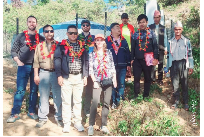
च्यारिटी वाटरका प्रतिनिधिहरू सम्मिलित टोलीले सुर्खेतस्थित कपासे खानेपानी तथा सरसफाइ आयोजनाको अनुगमन गर्दै

अनुगमनका क्रममा टोलीले मंसिर २६ देखि २८ गतेसम्म सिन्धुली र काभ्रेपलाञ्चोक जिल्लामा सञ्चालित खानेपानी तथा सरसफाइ आयोजनाहरूको अनुगमन गर्नुका साथै उपभोक्ता समितिका पदाधिकारीहरूसँग छलफल गरेको थियो । यस क्रममा अनुगमन