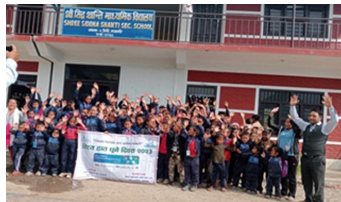
बागलुङमा आयोजित कार्यक्रमका सहभागीहरू

कर्मचारीहरू, स्थानीय तहका कर्मचारी, खानेपानी उपभोक्ता समितिका पदाधिकारीहरू लगायत उपभोक्ताहरूको उपस्थितिमा चेतनामूलक सन्देश लेखिएका ब्यानर, प्लेकार्ड तथा पम्पलेटहरू सहित विभिन्न समुदायको परिक्रमा गरेको थियो।